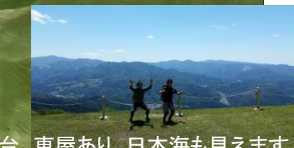
山頂手前の展望台。東屋あり、日本海も見えます