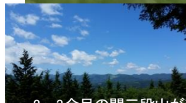
2~3合目の間三段山が望める