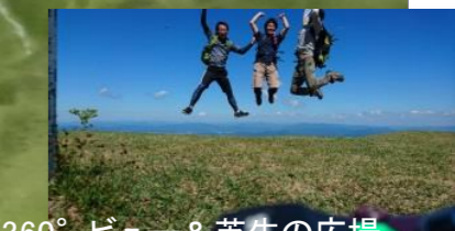
山頂360°ビュー&芝生の広場