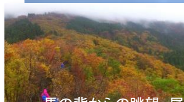
馬の背からの眺望、尾根を空中散歩